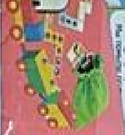
Иллюстрация истории по картинке